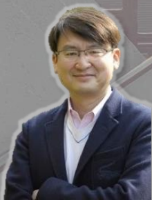
いくしま じゅん 生島 淳 氏 スポーツジャーナリスト

広告代理店勤務から、1999年に独立。オリンピック、ラグビーワールドカップなどの取材経験豊富。主な著書に「箱根駅伝ナインストーリーズ」「エディ・ジョーンズとの対話」など。TBSラジオ「日本全国8時です」(土曜8時)などラジオでも活躍。東京マガジンバンクカレッジパートナーである。