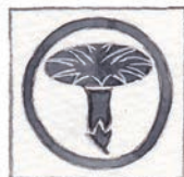
丸 まる に一つ朝顔 あさがお まる あさがお