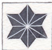
麻 あさ の葉 は あさ は