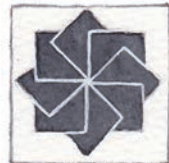
石 いし 車 ぐるま いし ぐるま