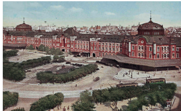
帝都の大玄関東京駅の壮観(大正3年竣工)

2018.10.25(木)▶12.16(日) 休館日 11.1(木)/11.16(金)/12.6(木) 都域の拡大と変貌 Expansion and transformation in a capital area