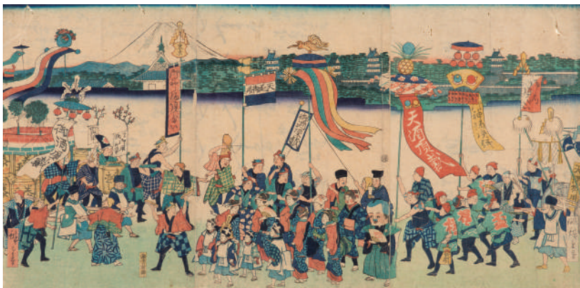
御酒頂戴 明治元年 三代安藤広重画