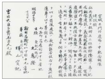
宮城正門外2贈正三位西郷隆盛銅像建設の件に付宮内大臣より指令の件 明治25年