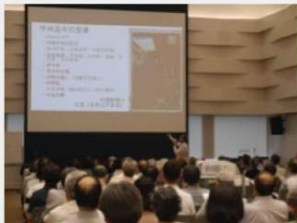
講演会「江戸から東京へ」

「東京マガジンバンクカレッジ」のイベントの予定は、広報紙、都立図書館ホームページ等に掲載するほか、チラシを区市町村立図書館にお配りしてお知らせします。これからも「東京マガジンバンクカレッジ」にご注目いただき、是非ご参加くださいますようお願いいたします。