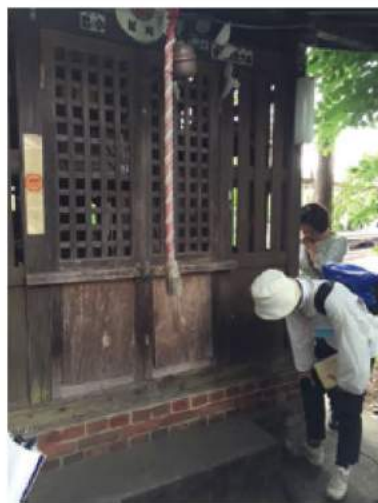
神社の土台に煉瓦