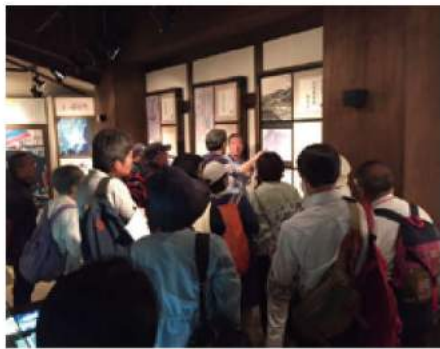
皆さん真剣！（絹の道資料館）

八王子はかつて桑都と呼ばれ、養蚕や織物の盛んな地域だった。そしてまた長野、山梨県などから横浜に生糸を運ぶための「絹の道」があった。現在整備保存されているその絹の道の近くに、「絹の道資料館」はある。鎌水の生糸商、八木下要右衛門の屋敷跡に、養蚕や生糸商人に関する資料を展示する為に建設されたものである。