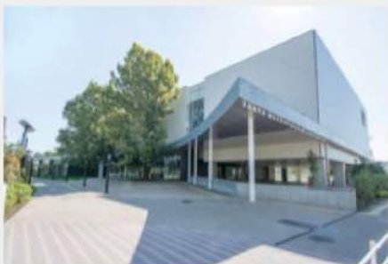
都立多摩図書館外観

移転を機に、雑誌をより一層活用していただくため、「東京マガジンバンクカレッジ」を開設いたしました。