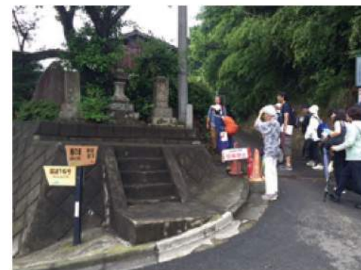
多摩シルクロードの入り口