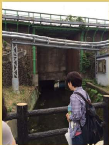
日野第一中学校 飯綱権現 日野用水堰 多摩川橋梁