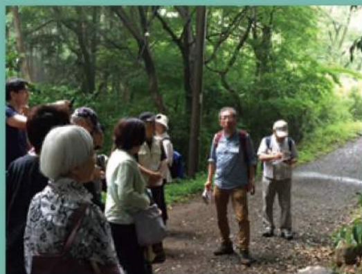
雨も上がり陽が差す絹の道